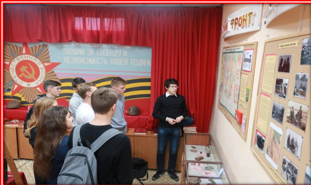
Я провожу экскурсию в нашем школьном Музее Боевой Славы