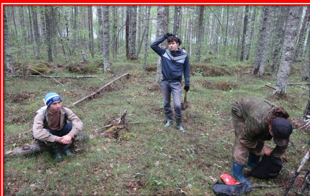
Фото с места раскопок, неподалёку от ст. Ванозеро